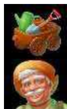
Vozík Scatter symbol